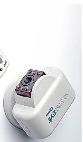
Figura 1: La IC-100A ed il suo telecomando.