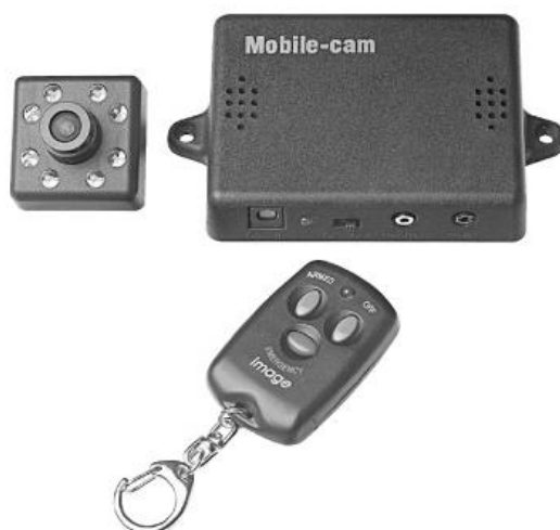
Figura 1: L'unità base della IC-100MA, la telecamera e il telecomando.