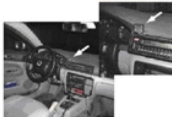
Figura 4: Esempio di utilizzo della telecamera in automobile.